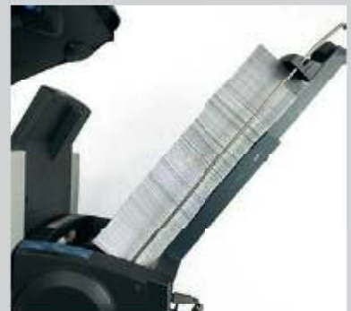
Der optionale Power Stacker behält die Druckreihenfolge bei und kann bis zu 800 Kuverts aufnehmen (Füllhöhe 50 cm).