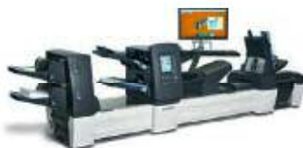
Kuvertiersystem SI 5450