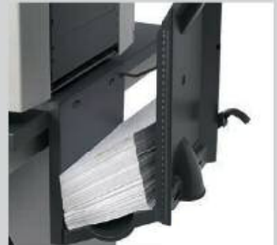
Standardablage für Kuverts