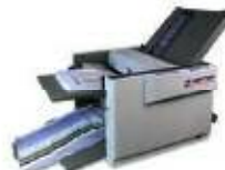
Falzmaschine TF MEGA-M plus